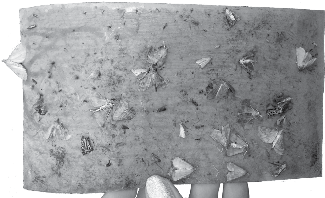
Рис. 2. Клеевой вкладыш из светодиодной ловушки, установленной на посевах кукурузы в окрестностях пос. Ботаника, с отловленными 9 самцами и 4 самками кукурузного мотылька

1 светодиодную ловушку составила в ценах весны — лета 2019 г. ~1000 руб.), следует иметь в виду, что их конструкция в отличие от феромонных ловушек предполагает многолетнее использование. Что же касается возможного негативного влияния световых ловушек на численность энтомофагов, то наши наблюдения свидетельствуют о том, что при размещении светодиодных ловушек на производственных посевах кукурузы на клеевых вкладышах доминирует целевой вид вредителя (рис. 2). Вполне вероятно мнение о том, что светодиодные ловушки уничтожают немалое число особей полезных видов (Кремнева и др., 2019) сложилось в силу того, что ловушки размещали на открытых пространствах (луг, посев люцерны, и т.п.).