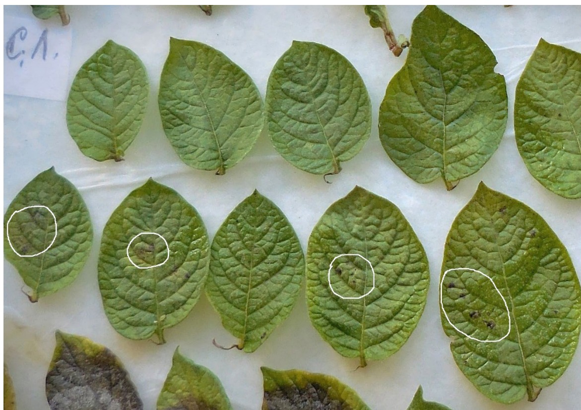
Рисунок 1. Реакция сверхчувствительности на отделенных долях листьев сорта Сеянец Лаптева (7-е сутки после заражения Phytophthora infestans )

на заражение Ph. infestans на листьях сорта Сеянец Лаптева появлялась реакция сверхчувствительности (рис.1). Устойчивость ботвы, найденная в полевом изучении, не подтвердилась у сортов Голубизна и Воля , ее оценивали баллами – 3.7 и 2.9, соответственно. Умеренной чувствительностью характеризовались сорта: Дарковичский , Елисеевский , Брянский Надежный , Маугли , Лина (средний балл 5); умеренной устойчивостью – сорт Теща (балл 5.7). В лабораторных опытах подтверждена устойчивость сортов: Белуха , Ветеран , Дебрянск , Калинка , Киви , Кустаревский , Лазарь , Никулинский и Пранса (таблица 1).