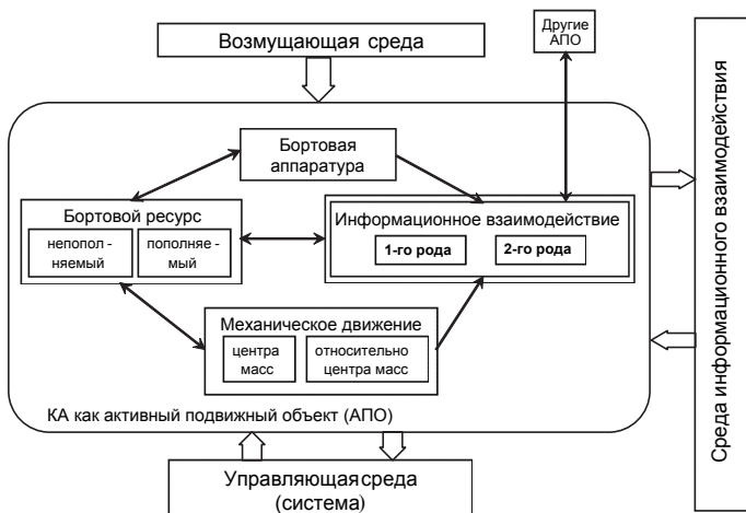
Рис. 1. Общая структурная схема КА как активного подвижного объекта

Кроме того, в соответствии с системным подходом исследование системы должно предполагать расширенное понимание среды , в которую “погружена” исследуемая система, т. е. других систем, влияющих на функционирование системы или подверженных влиянию с ее стороны. В общем случае понятие среды применительно к КА как информационному АПО предполагает рассмотрение трех составляющих . Это: