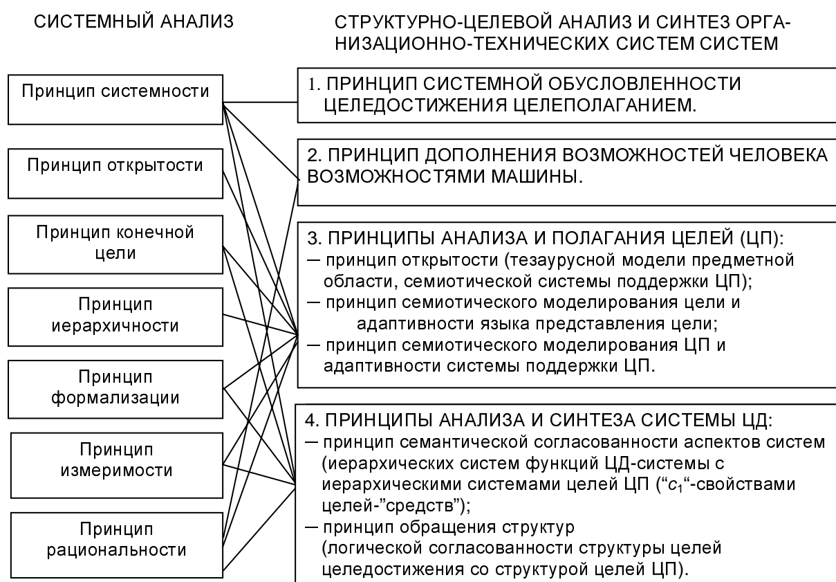
Рис. 2. Соотношение принципов системного анализа и структурно-целевого анализ и синтеза организационно-технических систем.

– борьба с фрагментарностью формализаций системно-аналитического процесса, затрудняющей единение используемых в нем методов и средств, а также проверку согласованности получаемых посредством них результатов. Второе направление – формализация начальных этапов системного анализа, в частности, задачи целеполагания, при решении которой человек часто допускает логические просчеты, существенно влияющие на качество последующих результатов системного анализа. Третье направление – разработка методологических регулятивов как направляющего базиса структурно-целевого анализа организационно-технических систем, который способствует повышению взаимопонимания лиц, принимающих участие в решении проблем организационно-технических систем и в управлении ими.