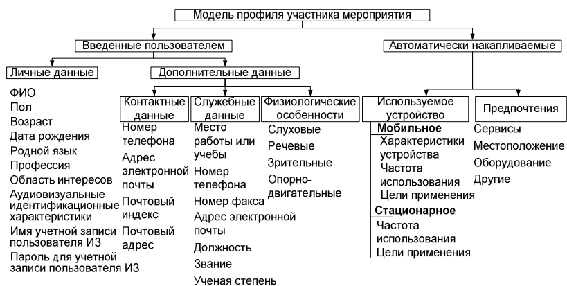
Рис. 1. Модель ПУМ.

Представленную структуру можно разделить на две категории данных: введенные пользователем и накапливаемые автоматически. Рассмотрим первую категорию, состоящую из подкатегорий «Личные данные» и «Дополнительные данные». Личные данные содержат персональные характеристики пользователя, а также его интересы и предпочтения. Кроме того, к ним относится информация об учетной записи пользователя интеллектуального зала. В подкатегории «Дополнительные данные» выделяют три типа дополнительной информации: (1) контактные данные; (2) служебные данные; (3) физиологические особенности.