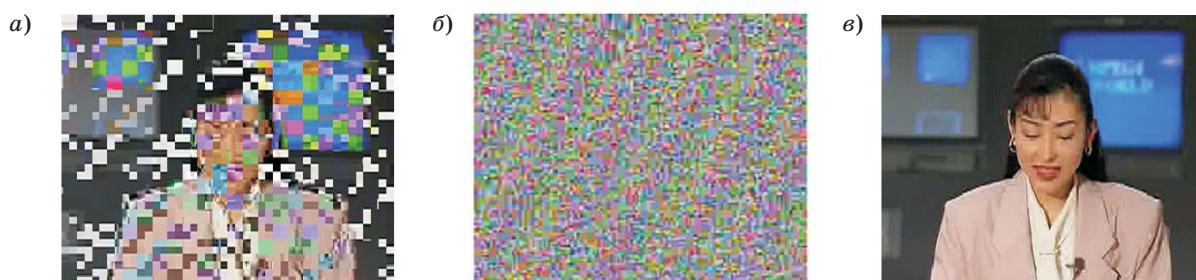
■ Рис. 1. Пример использования алгоритма RVEA (а), алгоритма Video Encryption Algorithm (б) к исходному изображению (в)

образом получается два списка — четные и нечетные байты. Результатом преобразования являются байты, полученные как побайтная сумма по модулю два (исключающее ИЛИ) четных и нечетных байт, и преобразованные с использованием симметричного алгоритма (AES, DES, ГОСТ 28147–89 и т. п.) нечетные или четные байты. Следует отметить недостаточную защищенность данного алгоритма при его использовании для обработки последовательности кадров и возможность применения атаки по выбранному исходному видеофрагменту. Очевидно, что данный недостаток может быть легко преодолен, если в алгоритме обработки использовать несколько раундов сети Фейстейла.