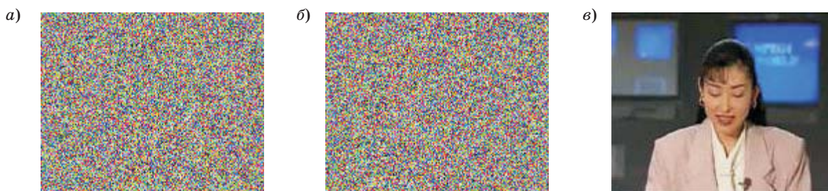
■ Рис. 2. Пример использования предложенного алгоритма при одной модификации ключа на пакет длиной 1200 байт (а), на блок длиной 64 бита (8 байт) (б) для исходного изображения (в)

Рассмотрим более подробно предлагаемый в данной работе блочный алгоритм преобразования, адаптируемый по параметру защищенность/сложность реализации. За его основу взята модификация алгоритма VEA [8] и сеть Фейстейла со стандартным размером входного информационного блока в 64 бита и длиной параметра K 256 бит. На каждом раунде выполняются простейшие (аналогичные ГОСТ 28147–89) операции замены и перестановки. Число раундов можно изменять от 8 до 16 в зависимости от требуемого соотношения защищенность/сложность реализации. Для согласования алгоритма с требованиями использующего его приложения преобразованию подвергаются пакеты данных, длина которых может лежать в некотором ограниченном диапазоне, но последовательные пакеты могут иметь разные длины и не обязательно кратные длине информационного блока в 64 бита. Функция K_{i0} = F(K_0, i) быстрой синхронизации реализована в виде, не зависящем от длины пакета, и использует некоторое, заранее фиксированное, количество операций арифметического сложения с игнорированием переполнения. Алгоритм был реализован в виде приложения на языке С и тщательно тестировался на различных изображениях. Проверялась эффективность алгоритма по изменению структуры аудиоданных.